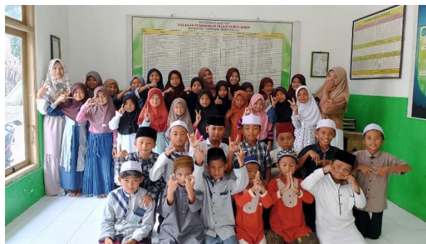
Gambar 2 : Dokumentasi kegiatan PKM di Madrasah Diniyah Miftahul Ulum Desa Grujugan Kidul, Kecamatan Grujugan, Kabupaten Bondowoso

Pelaksanaan kegiatan dilakukan melalui tiga metode utama, yaitu ceramah, diskusi interaktif, dan praktik. Metode ceramah digunakan untuk memberikan pemahaman konseptual mengenai materi Fiqih dasar. Selanjutnya, diskusi interaktif dimanfaatkan untuk memberikan kesempatan kepada peserta mengajukan pertanyaan, mendiskusikan berbagai persoalan Fiqih yang mereka temui dalam kehidupan sehari-hari, serta mengklarifikasi pemahaman yang masih kurang tepat. Tahapan terakhir berupa praktik dilaksanakan agar peserta memperoleh pengalaman langsung dalam menerapkan materi yang telah dipelajari sehingga pemahaman yang diperoleh tidak hanya bersifat teoritis, tetapi juga aplikatif.